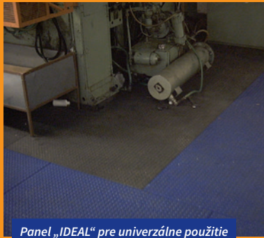
Panel „IDEAL“ pre univerzálne použitie

PVC panely sú chemicky a mechanicky veľmi odolné. Podľa testov, ktoré sa robili v uznávanej nemeckej skúšobni je bezpečnosť proti sklzu oproti materiálu guma a umelá hmota za sucha aj za mokra hodnotená výsledkom „VEĽMI BEZPEČNÉ“. Pri dotyku s materiálom koža za sucha aj za mokra je tento hodnotený výsledkom „BEZPEČNÝ“.