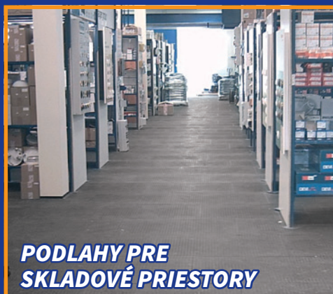
PODLAHY PRE SKLADOVÉ PRIESTORY