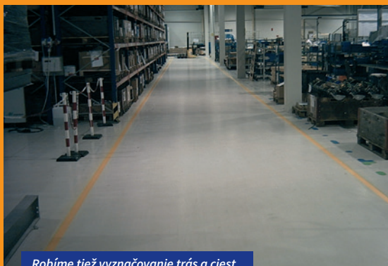
Robíme tiež vyznačovanie trás a ciest