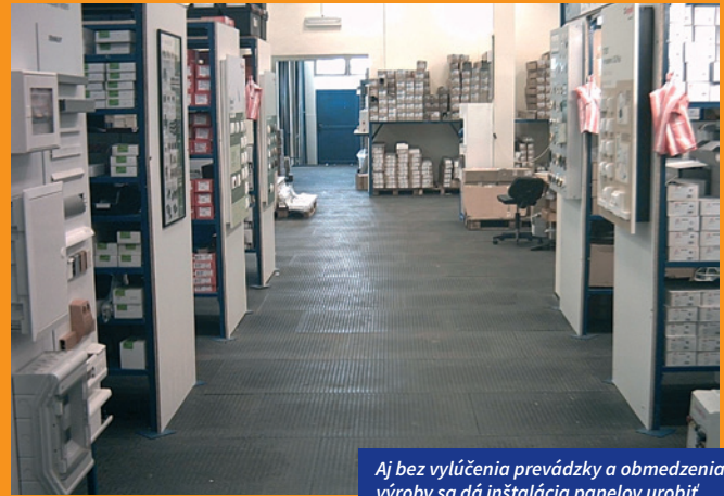
Aj bez vylúčenia prevádzky a obmedzenia výroby sa dá inštalácia panelov urobiť