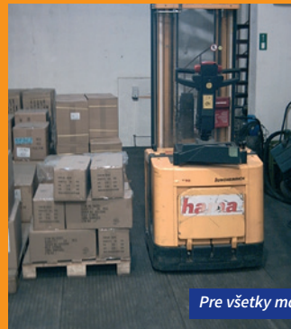
Pre všetky manipulačné stroje

S veľkým úspechom sú panely využívané napr. tiež na výstaviškách, na rýchle zakrytie výstavných plôch alebo na spevnenie prístupových ciest. Výhodou týchto panelov je ľahká montáž, demontáž a nenáročné skladovanie.