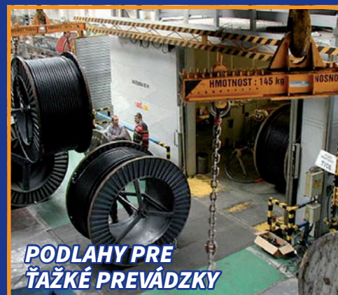
PODLAHY PRE ŤAŽKÉ PREVÁDZKY

Objednajte naše podlahy a ukončíte opakované opravy.