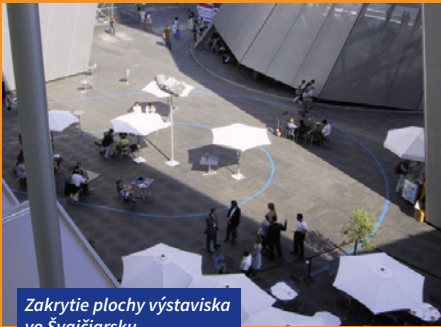
Zakrytie plochy výstavniska vo Švajčiarsku

S veľkým úspechom sú panely využívané napr. tiež na výstaviškách, na rýchle zakrytie výstavných plôch alebo na spevnenie prístupových ciest. Výhodou týchto panelov je ľahká montáž, demontáž a nenáročné skladovanie.