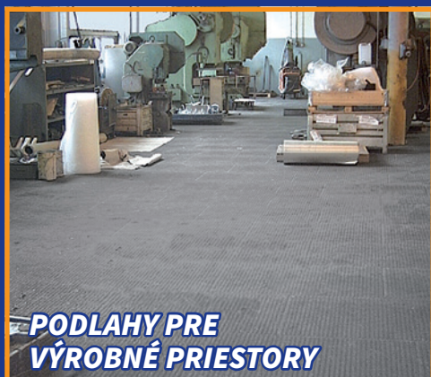
PODLAHY PRE VÝROBNÉ PRIESTORY