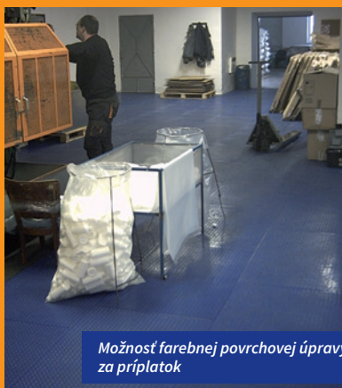
Možnosť farebnej povrchovej úpravy za príplatok