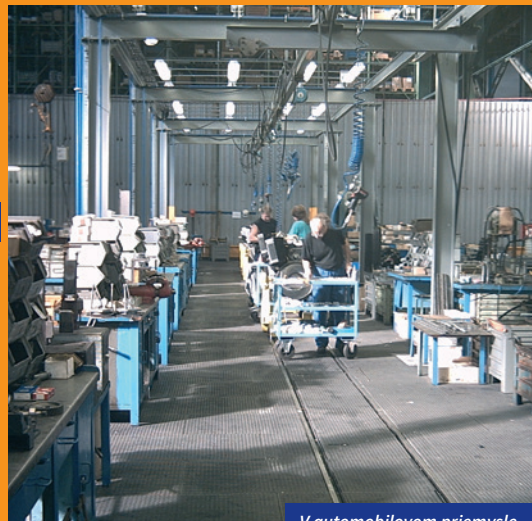
V automobilovom priemysle

S voľbou optimálneho typu panelov pre Vašu prevádzku Vám radi pomôžeme. Na základe Vašich predstáv, požiadaviek a plánov Vám dáme návrh na individuálne riešenie Vašich podlahových plôch. Využite naše skúsenosti.