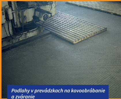
Podlahy v prevádzkach na kovoobrábanie a zváranie