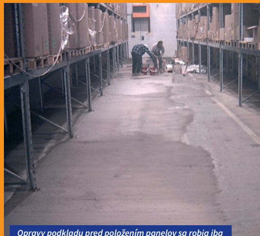
Opravy podkladu pred položením panelov sa robia iba v nutných prípadoch

Dokonalejšie vyrovnanie podkladu súvisí s menším zaťažovaním panelov v priebehu ich používania. Mastnota, praskliny, vlhkosť či rôznorodý podklad nebránia inštalácii našich podláh. V týchto zložitých podmienkach sú pre Vás naše panely IDEÁLNYM RIEŠENÍM.