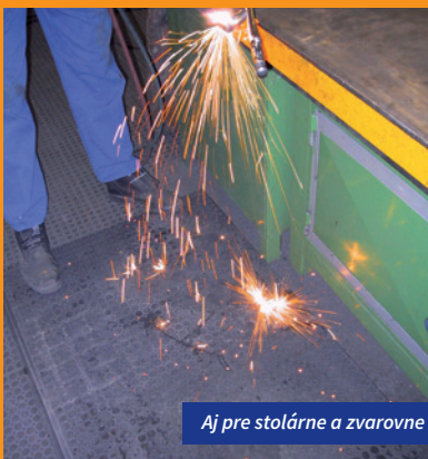
Aj pre stolárne a zvarovne