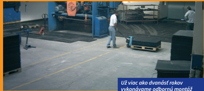
Už viac ako dvanásť rokov vykonávame odbornú montáž

Maximálne zaťaženie panelov je možné do 2 – 6 ton/dm 2 podľa typu. Napr. nákladné auto s predpokladanou plochou dotyku 4 × 2 dm 2 by mohlo vážiť až 48 ton.