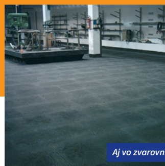
Aj vo zvarovniach a zlievniach