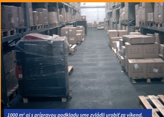
1000 m 2 aj s prípravou podkladu sme zvládli urobiť za víkend. Napriek tomu, že v tomto prípade bola potrebná príprava podkladu, ktorú vidíte na vedľajšom obrázku, tak celá akcia bola urobená bez obmedzenia prevádzky.

Podklad určený pre polozenie podlahových panelov z PVC často nevyžaduje žiadnu prípravu, alebo iba menšie miestne úpravy, ktoré sa dotýkajú skôr väčších nerovností. Toto sa robí pre lepší konečný efekt, alebo pre dosiahnutie väčšej životnosti panelov. Lepším vyrovnaním podkladu dosiahneme toho, že panely majú dlhšiu životnosť.